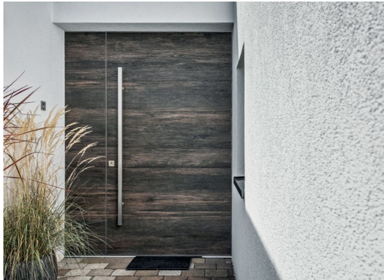
Pivot Haustür mit Keramikdeck