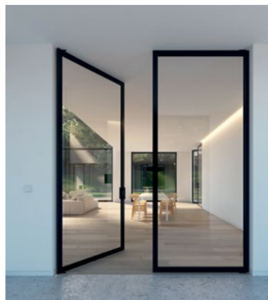
2-flügelige raumhohe Pivot Glastür