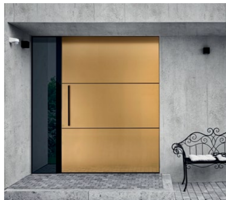
Pivot Haustür mit PVD-Deck (Aufteilung nach Kundenwunsch)

Die Pivot Beschläge erlauben die Haustürfertigung in großen Dimensionen und mit hohem Gewicht für eine individuelle Haustür, passend zur Fassade. Die Deckflächen der Tür können so auf dem Seitenteil und der Fassade flächenbündig fortgeführt werden.