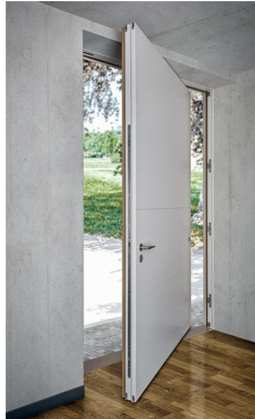
Pivot Haustür mit barrierefreier Bodenschwelle

INDIVIDUELLE HAUSTÜREN MIT DESIGNANSPRUCH UND SICHERHEIT