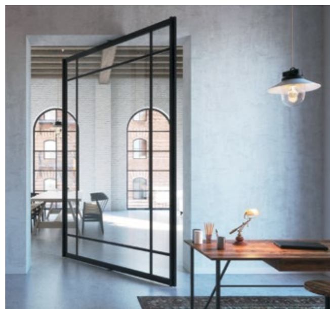
Pivot Türen mit mittigem Drehpunkt